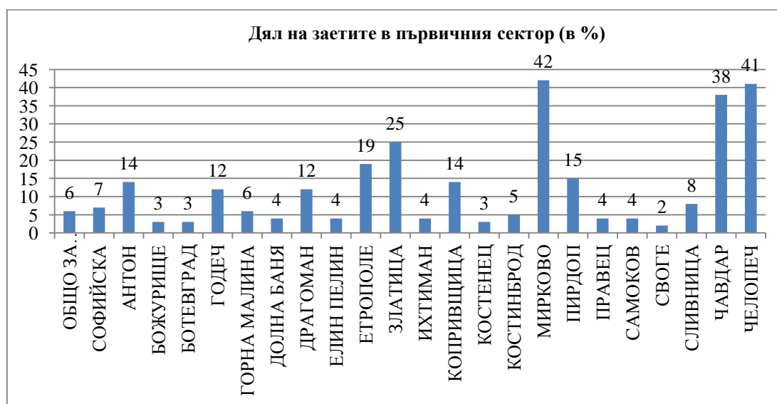
Фиг. 2. Дял на заетите в първичния сектор в селските райони на Софийска област (в %)

С голяма диференцираща роля и широко практическо приложение е показателя коэффициент на предприемаческа активност на населението . Той все още не е достатъчно популярен, но представлява отношение между броя на МСП и броя на икономически активното население на селския район. Като цяло предприемаческата активност в Софийска област е по-ниска от средната за страната (табл. 3). Това е характерна особеност за по-голяма част от селските райони в страната и особено за онези от тях, при които застаряването на населението е много по-силно изявено като процес. Според коефициента на предприемаческа активност на населението селските райони в проучваната територия се групират така: с най-висока стойност над 10% са селските райони Ботевград, Копривщица, Костинброд, Пирдоп, Правец, Самоков и Челопеч. Само в Пирдоп коефициента на предприемаческа активност е по-висок от средния за страната – 11.95%. В групата със средни стойности на показателя (5%-10%) попадат селските райони Антон, Божурище, Годеч, Горна Малина, Долна Баня, Елин Пелин, Етрополе, Костенец, Сливница, Мирково, Своге, следвани от Драгоман, Ихтиман и Чавдар. Само в Златица предприемаческата активност е под 5% (табл. 3).