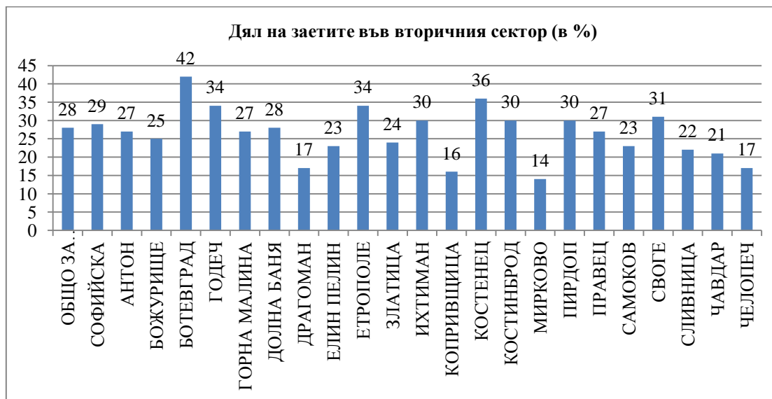
Фиг. 3. Дял на заетите във вторичния сектор в селските райони на Софийска област (в %)

население от общото население на селския район. Различията по този показател са много големи: има селски райони с изцяло селско население, както и селски райони с изцяло градско население (табл. 1).