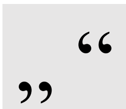
Фиг. 1. Кавички на български език.